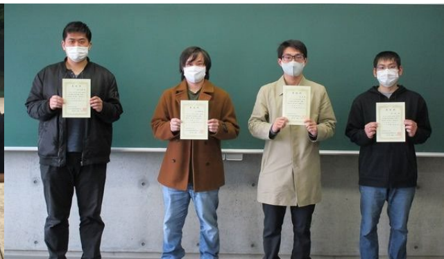
四日市市学生選挙啓発活動表彰を受けた学生たち