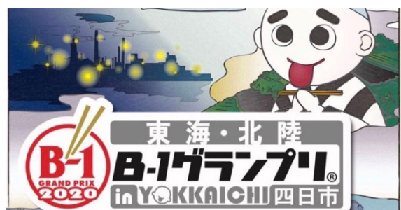
延期になった東海・北陸 B-1 グランプリ in 四日市のポスター（部分）

誘致に成功し令和2年5月に四日市での開催が予定されていた東海・北陸B-1グランプリは、新型コロナウイルスの感染拡大の影響で無期延期となってしまいましたが、いずれ開催される日に向けて、この準備も進めています。また、対外発信だけではなく四日市の魅力を発掘することで、市民のまちへの愛着や自信・誇りを高めていこうとする「四日市まちづくりカフェ」という取り組みも平成26年度から始め、隔月で開催しています。