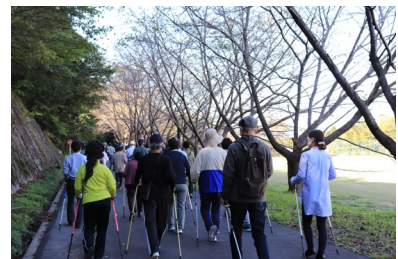
ノルディックウォーキングで学内を一周

今後も、四日市大学のもつ資産を活用し、魅力のある講座を提案したいと考えています。