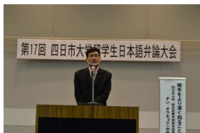
留学生日本語弁論大会

令和 3 年度については、新型コロナウイルス感染拡大の影響を鑑みながら、これまでの活動を継続し、地域社会との連携や学内における日本人学生との交流活動について積極的に実施する計画です。