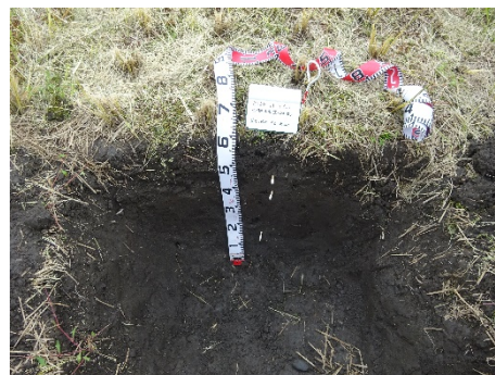
土づくり効果検証実験での土壌調査

今年度から特定プロジェクト研究として認定された「北勢地域における森林価値再発掘と里山圏資源循環モデルの構築」を軸に、農林業の振興と森林里山保全に関する調査研究を進めていきます。