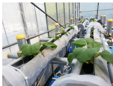
IoT を活用した自動栽培システム開発のための栽培ユニット試作