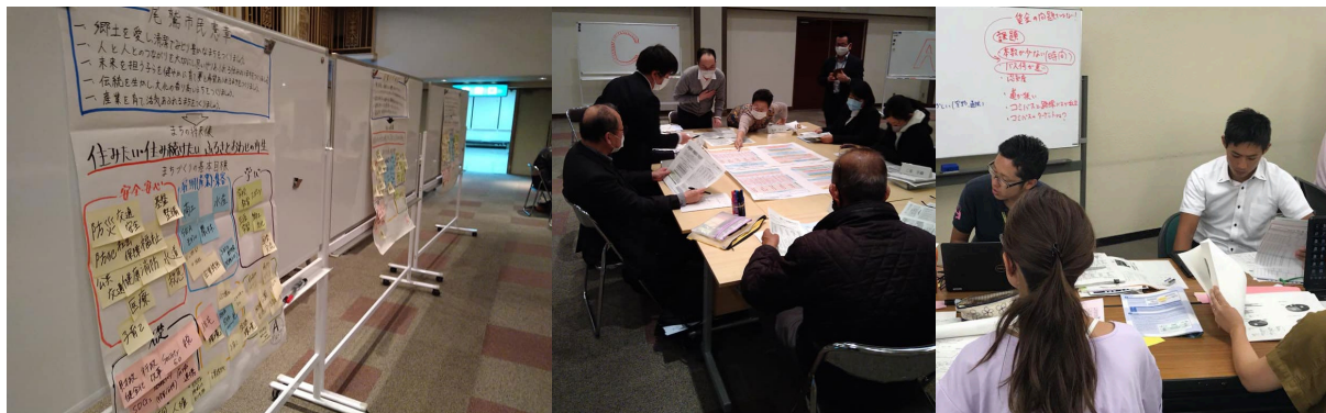
本研究所の研究員による現地指導等の様子

また、本研究所の研究員は、三重県や四日市市や鈴鹿市、亀山市、伊賀市、尾鷲市、東員町などの三重県内の自治体のみならず、知多市、岩倉市、長久手市、東近江市など、多くの県外の自治体でも、要請を受けて講演や現地指導等を行いました。これまで本研究所の研究員が各地の自治体で実施してきた事業が、相応の評価を受けているものと思われます。