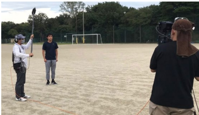
選挙啓発動画の撮影風景

こうした学生の活動は、選挙事務関係者や議会関係者、マスコミなど、多くの方からも注目・評価いただいております。特に熱心に活動してきた学生たちは、四日市市選挙管理委員会から「四日市市学生選挙啓発活動表彰」を受賞しました。