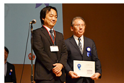
留学 AWARDS 表彰式