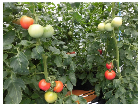
温泉を活用したトマトの栽培実験