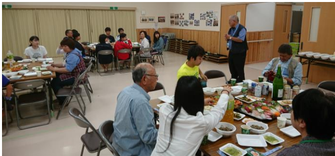
夕食交流会で前夜祭