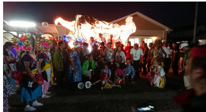
歴代ハネトチャンピオンと記念撮影