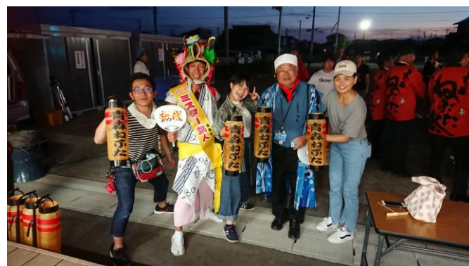
いよいよ青森ねぶた&夏まつり開始