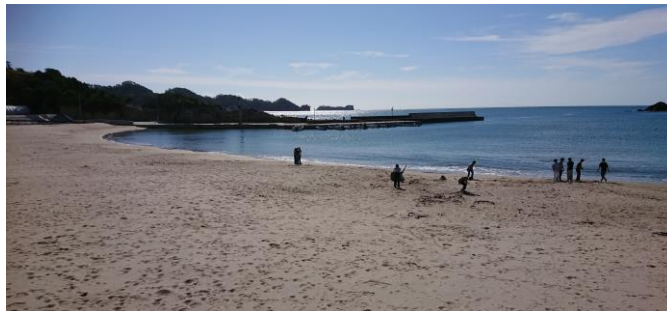
津波が襲った月浜は海水浴復活！