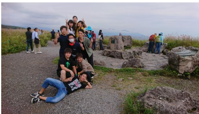
帰路は渋滞を避けて長野経由(霧ヶ峰)