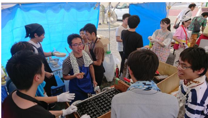
屋台の準備に取りかかる