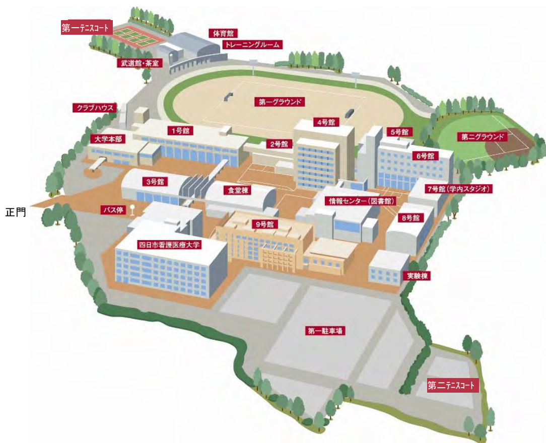
図 2-9-①-1 校舎等施設の概要 (キャンパス全体イメージ図)

校舎面積には含まれていないが、平成 22 (2010) 年 3 月に隣接する四日市看護医療大学へ移管された 9 号館は、講義室、研究室、学生ラウンジとして併用している。